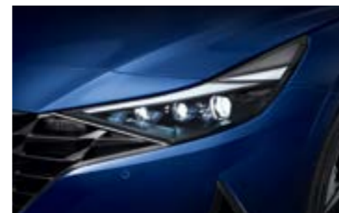
Жарықдиодты алдыңғы фаралар