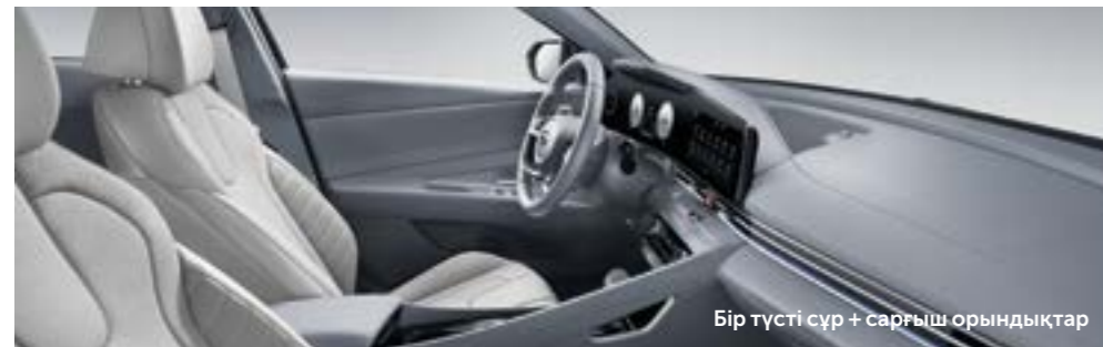
Бір түсті сұр + сарғыш орындықтар