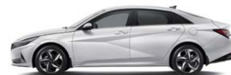
Өсаралық қашықтық 2 720 Габаритті ұзындығы 4 650