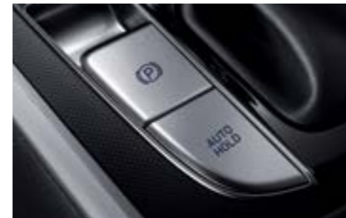
Автоматты ұстау режимі бар электронды тұрақ тежегіші (EPB)