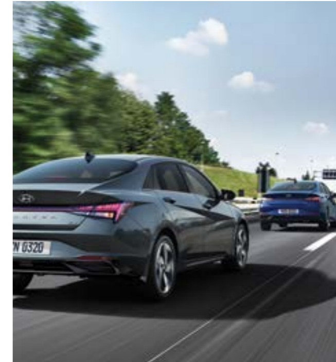
Көлік кептелісінде қозғалыс көмекшісі бар интеллектуалды круз-бақылау (SCC)

Жүргізуші белгілеген жылдамдықты сақтайды.