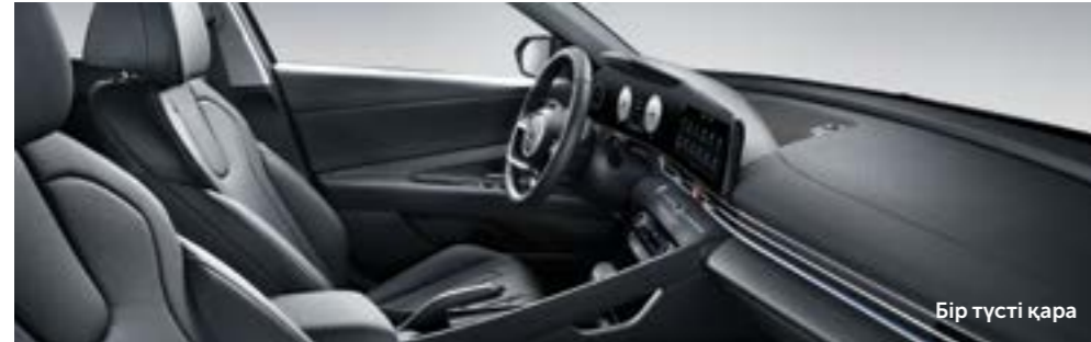
Бір түсті қара