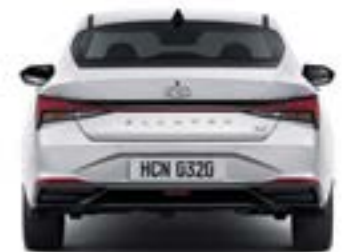
МДөңгелекаралық қашықтық 1 604 (1 590) Габаритті ені 1 825