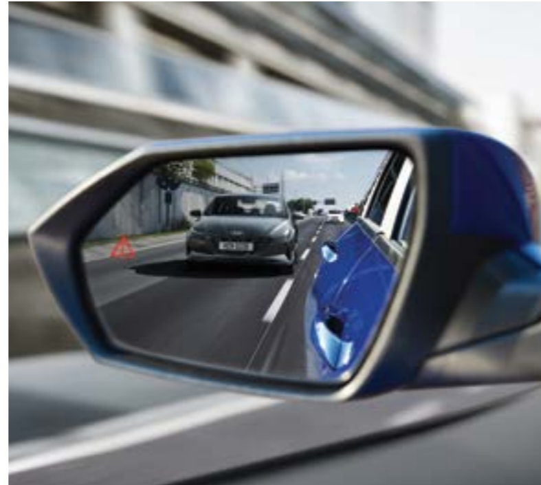
Соқыр аймақтарды бақылау жүйесі (BCW)

Егер алда келе жатқан көлік құралының жылдамдығы күрт төмендей бастаса, сондай-ақ жаяу жүргіншімен немесе тұраққа қойылған автомобильмен соқтығысу қаупі туындаса, жүргізушіге қауіп туралы ескертеді. Егер ескертуден кейін қауіптілік деңгейі арта берсе, шұғыл тежеу режимі автоматты түрде қосылады. Шұғыл тежеу сол жаққа бұрылғанда қарсы бағытта келе жатқан көлік құралымен соқтығысу қаупі бар жағдайда да іске қосылуы мүмкін.