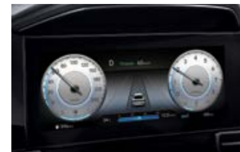
Диагонали 10,25" цифрлық бақылау тақтасы