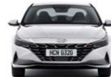
Дөңгелекаралық қашықтық 1 593 (1 579) Габаритті ені 1 825

Өлшем бірліктері: мм, дөңгелекаралық қашықтық 15" дискілердің диаметріне қарай есептеледі. Жақшадағы мән 17" диаметріне байланысты есептеледі.