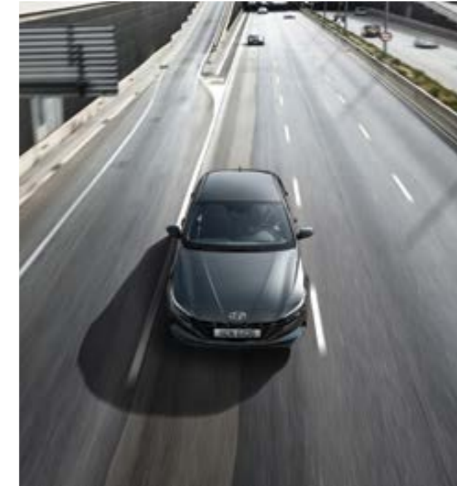
Автомобильді қозғалыс жолағының ортасында ұстау жүйесі (LFA)

Алда келе жатқан көлік құралына дейін берілген жылдамдық пен қашықтықты сақтайды. Қысқа уақытқа тоқтаған кезде қозғалысты автоматты түрде қайта бастайды.