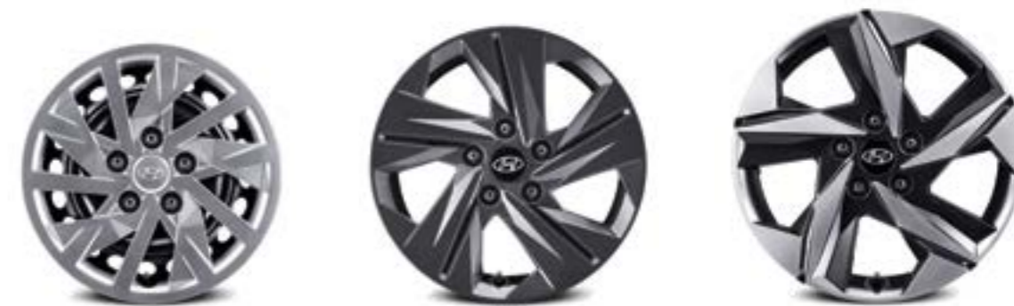
15-дюймдік болат дөңгелек дискілері мен қақпақтары