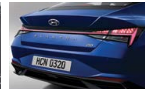
Артқы жарықдиодты құрамдастырылған шамдар