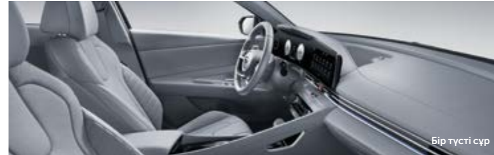
Бір түсті сұр