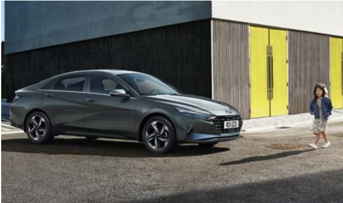
Солға бұрылған кезде қарсы қозғалысты басқару функциясы бар (FCA-JT) алдыңғы кедергі алдындағы автоматты тежеу жүйесі (FCA)

Егер алда келе жатқан көлік құралының жылдамдығы күрт төмендей бастаса, сондай-ақ жаяу жүргіншімен немесе тұраққа қойылған автомобильмен соқтығысу қаупі туындаса, жүргізушіге қауіп туралы ескертеді. Егер ескертуден кейін қауіптілік деңгейі арта берсе, шұғыл тежеу режимі автоматты түрде қосылады. Шұғыл тежеу сол жаққа бұрылғанда қарсы бағытта келе жатқан көлік құралымен соқтығысу қаупі бар жағдайда да іске қосылуы мүмкін.