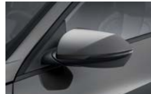
Сыртқы айналарды бүктеуге арналған электр жетегі