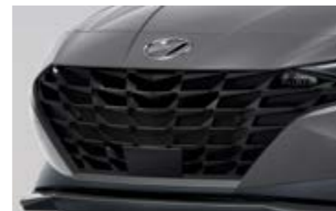
Қара радиатор торы