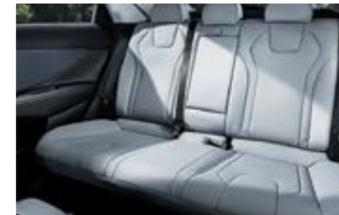
Былғарымен қапталған салон