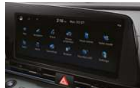
10,25-дюймовый дисплей мультимедийной системы