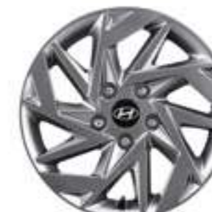
16-дюймовые легкосплавные колесные диски