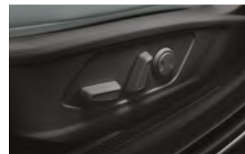
Водительское сидение с электроприводом регулировки в 8 направлениях и поясничной опорой