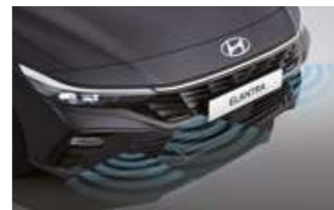
Датчики парковки спереди и сзади