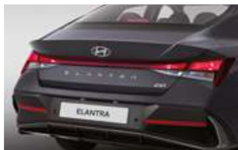
Галогенные задние комбинированные фонари