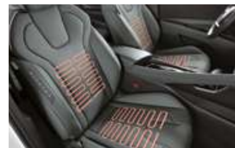
Подогрев передних и задних сидений