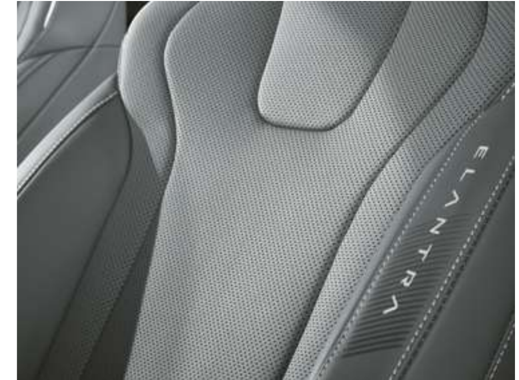
Обивка сидений из искусственной кожи

Для отделки передней панели со стороны пассажира и дверных панелей используются материалы премиум-класса.