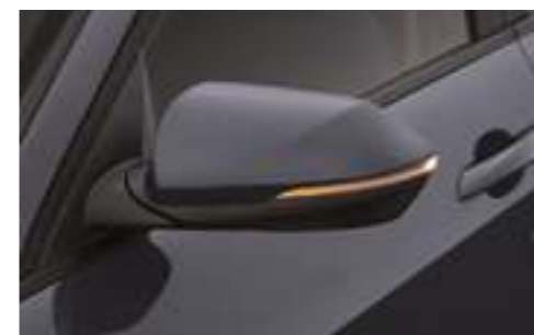
Наружные зеркала заднего вида с обогревом, электроприводом складывания и регулировки, и светодиодными повторителями указателей поворота