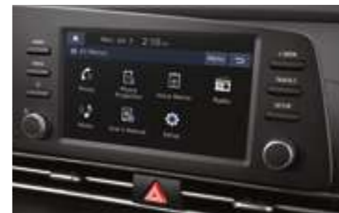
8-дюймовый дисплей мультимедийной системы