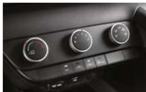
Климатическая установка с ручным управлением