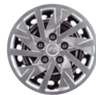
15-дюймовые стальные колесные диски