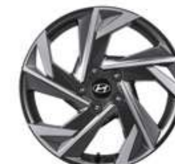
17-дюймовые легкосплавные колесные диски