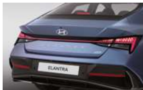
Светодиодные задние комбинированные фонари