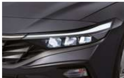
Светодиодные фары (MFR)