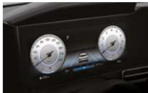
Комбинация приборов (10,25-дюймовый цветной ЖК-дисплей)