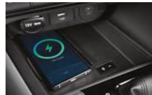
Система беспроводной зарядки смартфонов