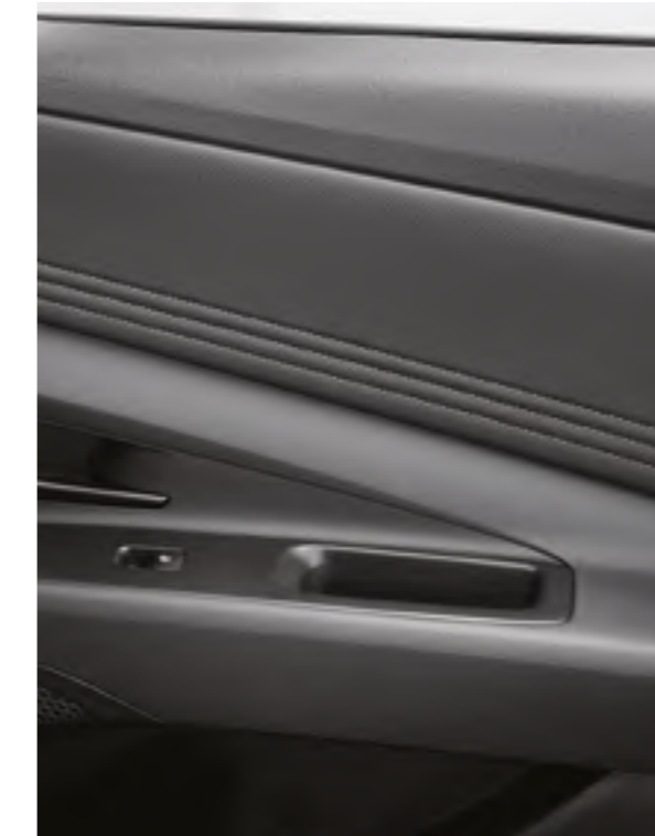
Отделка салона в мягких тонах

Современный дизайн и экологичные материалы создают атмосферу изысканную и утонченную.