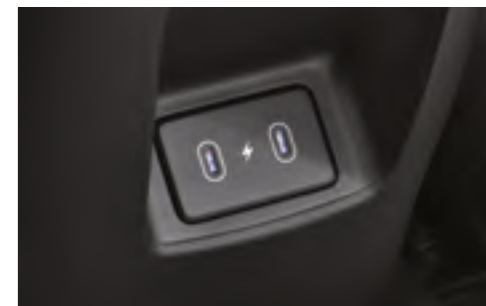
Разъем USB Type-C для зарядки мобильных устройств на втором ряду