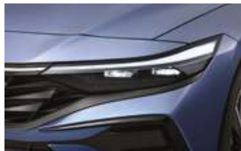
Узкая светодиодная полоса дневных ходовых огней