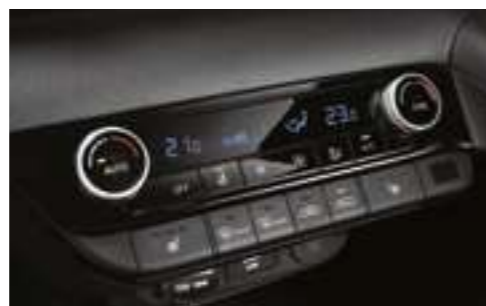
Двухзонный климат-контроль с автоматическим управлением