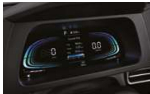
Комбинация приборов (4,2-дюймовый цветной ЖК-дисплей)